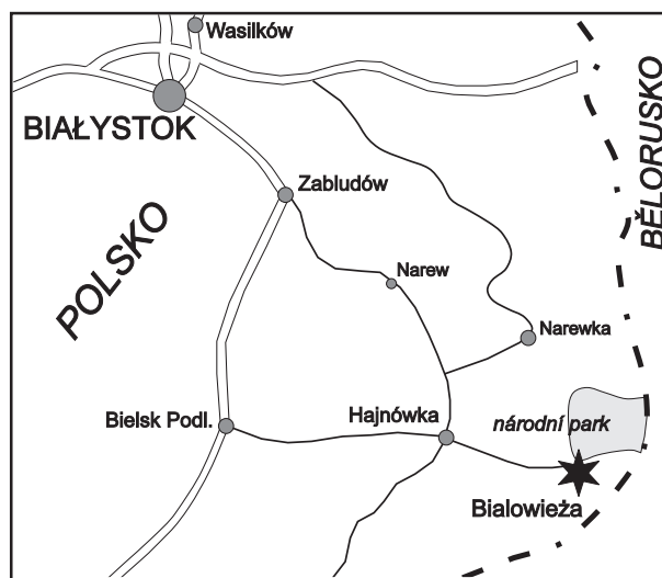
Bělověžský národní park

V centru parku se rozkládá areál muzea s hotelem Iwa, postavený v místech carského paláce. Západně od něj se dochoval rozsáhlý a dřevěný Výletní dům (Dom Wycieczkowy PTTK), v němž byly za carských dob umístěny stáje. Ještě západněji u hranice parku je postaven z červených cihel Dom Marszałkowski. Bydleli v něm carští důstojníci a dnes zde sídlí vedení parku.